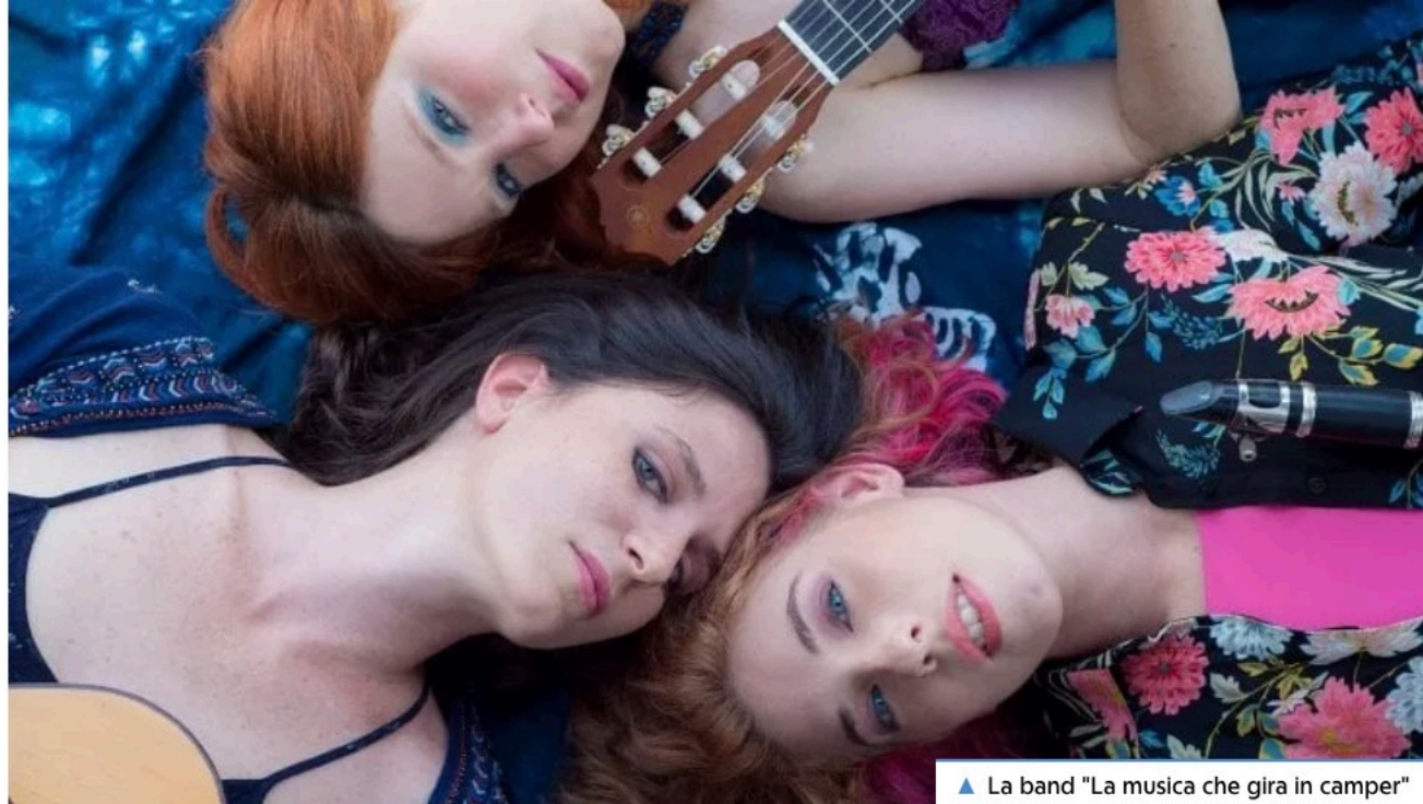
▲ La band "La musica che gira in camper"

Spettacoli al Teatro di Verdura, al Real Teatro Santa Cecilia e al Chiostro di Sant'Anna